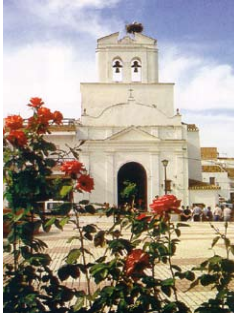
IGLESIA PARROQUIAL DE SANTA MARÍA DE GUADALUPE Arquitectura y arte neoclásico. Siglos XVIII y XIX