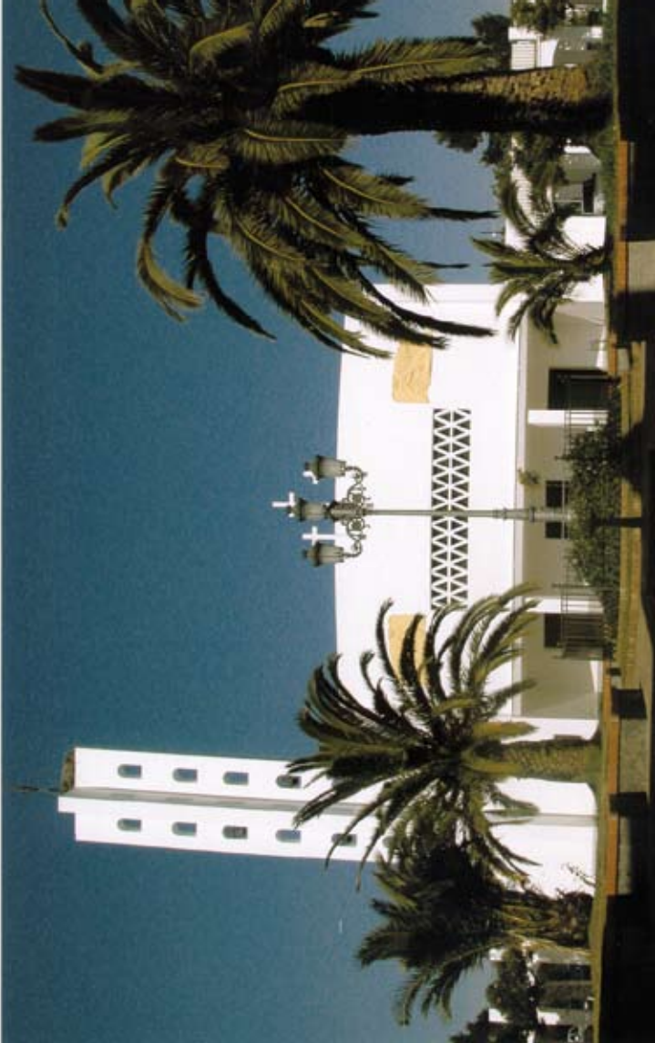
PARROQUIA ESTELLA DEL MARQUÉS