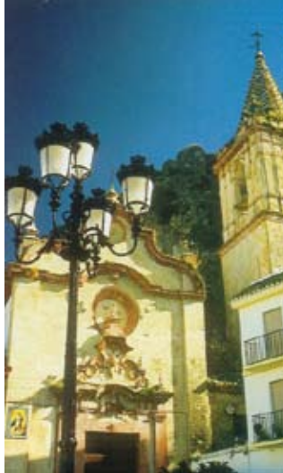
IGLESIA PARROQUIAL SANTA MARÍA DE LA MESA Arquitectura y arte barroco. Siglo XVIII. Museo-Tesoro Parroquial