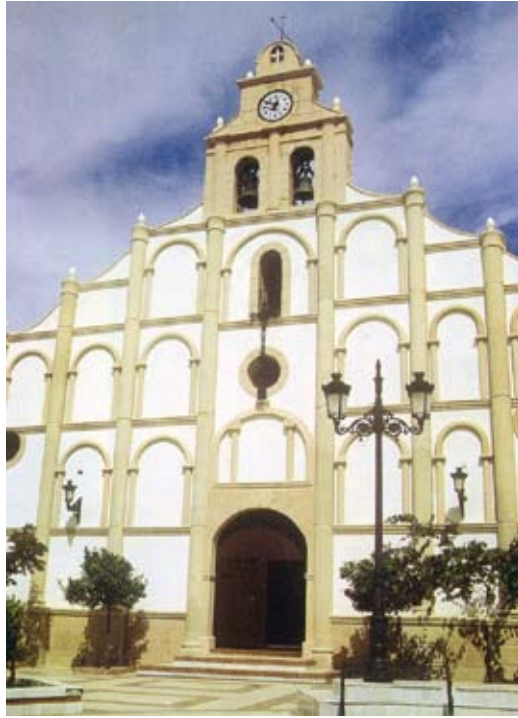
IGLESIA PARROQUIAL SANTA MARÍA DEL VALLE Arquitectura religiosa. Siglos XVIII y XIX.