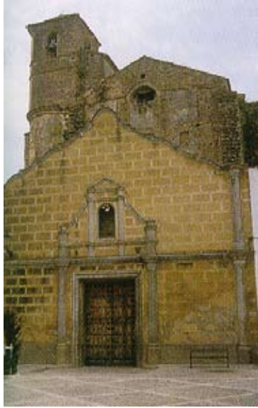
IGLESIA PARROQUIAL NUESTRA SEÑORA DE LA ENCARNACIÓN Arquitectura y arte gótico y renacentista. Siglo XVI.