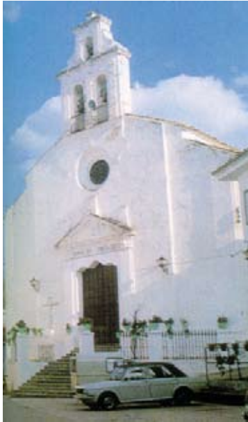
IGLESIA PARROQUIAL DE SAN JOSÉ Arquitectura neoclásica. Siglo XVII.