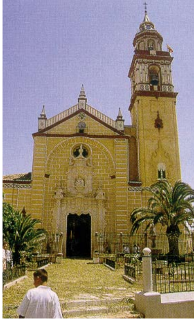
IGLESIA PARROQUIAL SANTA ANA Arquitectura y arte barroco y neoclásico. Siglo XVIII